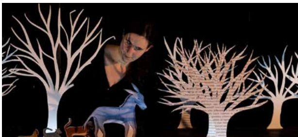
LA FORÊT DES CONTES / MARCHENWALD CIE ABOUDBRAS Conte

👥 Partenaires : Mix' Arts Myrys - Toulouse, Illiade - Illkirch