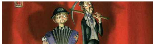
LES CROQUES MORTS CHANTEURS FIRMIN & HECTOR Spectacle musical jeune public

★ Coproduction : Ballet de l'Opéra national du Rhin / Centre Chorégraphique National de Mulhouse 🧑‍🤝‍🧑 Partenaires : Théâtre du Marché aux Grains de Bouxwiller, Agence Culturelle Grand Est, Réservoir Danse de Rennes Métropole, Espace Malraux de Geispolsheim, Centre Chorégraphique de la Ville de Strasbourg, Pôle-Sud / CDCN de Strasbourg