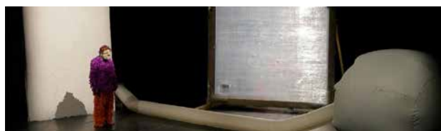
APPEL D'AIR LA PERSISTANCE DE LA MEMOIRE Cie Pignata Corpus Théâtre/marionette

★ Coproduction : Le Point d'Eau (Ostwald) et Ateliers Créé tes chansons 👍 Soutiens : Région Grand Est