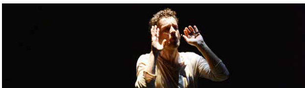
NTONI Cie Lavoro Nero Teatro Théâtre musical

★ Coproduction : TJP CDN d'Alsace Strasbourg 👍 Soutiens : Région Grand Est - DRAC Grand Est 🧑‍🤝‍🧑 Partenaires : Agence Culturelle Grand Est