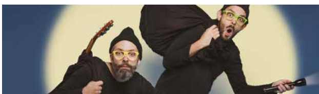
BOOGRR ! Lionel Grob Concert jeune public

★ Coproduction : JM France et Festival International Jeune Public Momix 👍 Soutiens : SACEM, la Ville de Strasbourg, la Région Grand Est et la DRAC Grand Est 🧑‍🤝‍🧑 Partenaires : La Nef de Wissembourg, le Pôle Culturel de Drusenheim