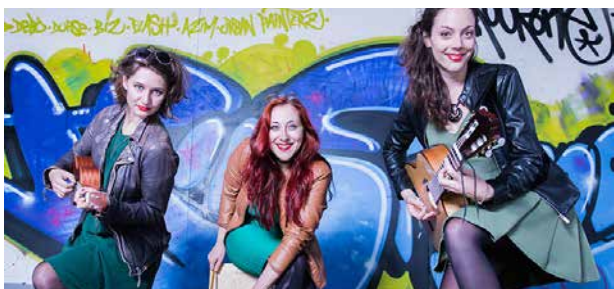
THE CRACKED COOKIES SHOW THE CRACKED COOKIES Spectacle musical

★ Coproduction : Le Diapason - Espace Culturel de Vendenheim