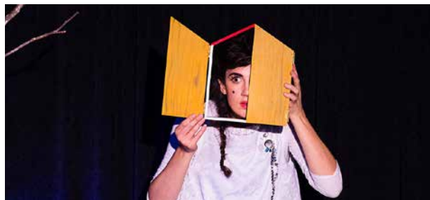
LES PAS PAREILS CIE L'INDOCILE Théâtre

📍 Soutiens : Conseil Départemental 67/le Vaisseau