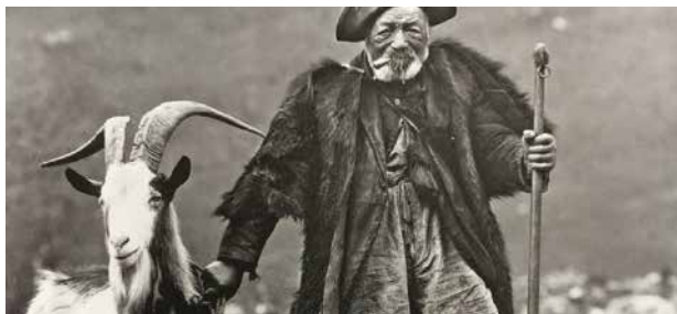
COMMENT JE NE SUIS PAS DEVENU CHANTEUR YAN CAILLASSE Spectacle musical