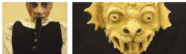
GUGUCK Voix point comme Théâtre

★ Coproduction : Les Tanzmatten - Ville de Sélestat 👍 Soutiens : Triangle de Huningue, Istituto Italiano di Cultura di Strasburgo, SPEDIDAM et Ville de Strasbourg-Eurométropole