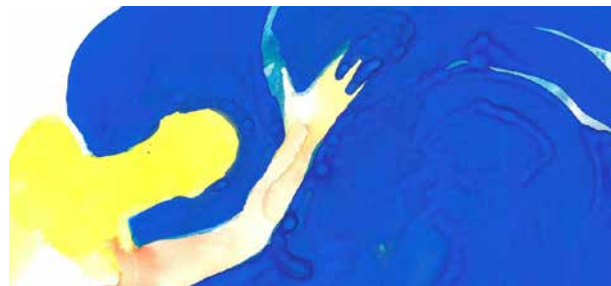
FARWIN CIE OZ LA MUSE Conte chorégraphique

👥 Partenaires : Agence Culturelle Grand Est, TAPS Strasbourg