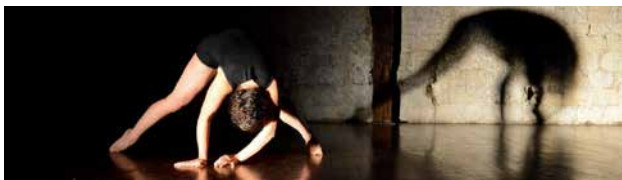
POLYMORPHOSIS Cie MUJTOS Danse

★ Coproduction : Ballet de l'Opéra national du Rhin / Centre Chorégraphique National de Mulhouse 🧑‍🤝‍🧑 Partenaires : Théâtre du Marché aux Grains de Bouxwiller, Agence Culturelle Grand Est, Réservoir Danse de Rennes Métropole, Espace Malraux de Geispolsheim, Centre Chorégraphique de la Ville de Strasbourg, Pôle-Sud / CDCN de Strasbourg